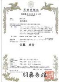
「魂の継承」商標登録番号 第 5605501 号

物質 (人、物、金、情報) を残すのか？ あなたの、性格、戦略、理念を残すのか？ それとも、魂を継承するのか？